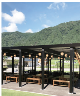
完成したバーベキュー場

バーベキュー場のホームページ制作については、本会会員事業所を紹介し、魅力あるホームページが完成しました。