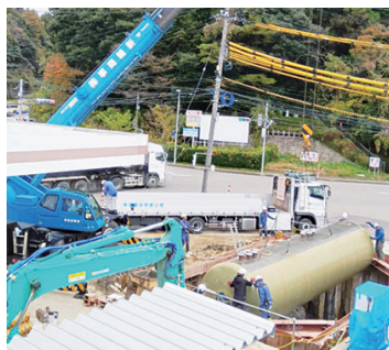
地下タンクの入替工事の様子

能登半島地震・奥能登豪雨の被災地の商工会では、事業者のなりわい再建や地域の復興に向けた様々な取組を行っています。本コーナーでは、これらの取組をシリーズでご紹介します。第一回目の今回は、穴水町商工会の事例です。