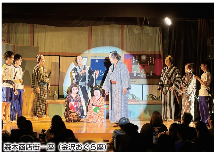
森本商店街一座 (金沢おぐら座)