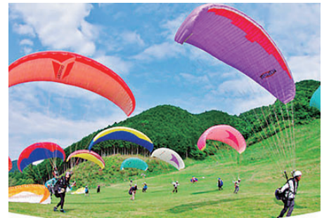
店舗近くの「獅子吼高原」

比咩神社」や「獅子吼高原」「石川県ふれあい昆虫館」などから、アクセスしやすい場所に立地しています。