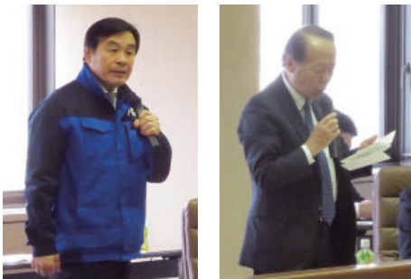
挨拶する長基会長（右）と馳知事（左）

県連合会は、さる三月二十四日、令和六年度臨時総会を開催。七年度事業計画・収支予算など、全ての議案が原案どおり承認された。来賓として、馳浩県知事のご臨席をいただいた。なお、事業計画の概要は、次のとおり。