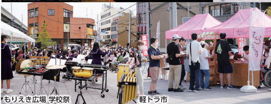
もりえき広場 学校祭