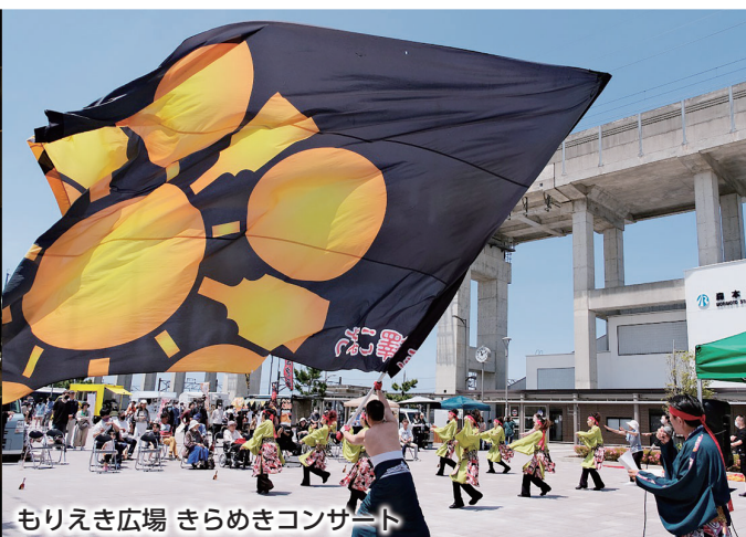
もりえき広場 きらめきコンサート